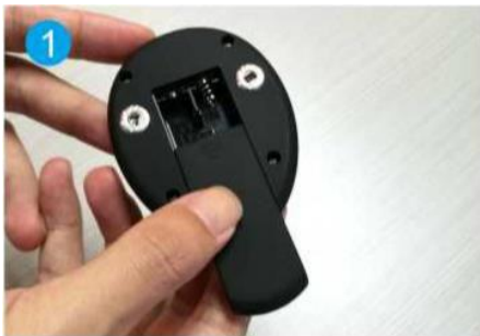
1. Otevřete prostor pro baterie