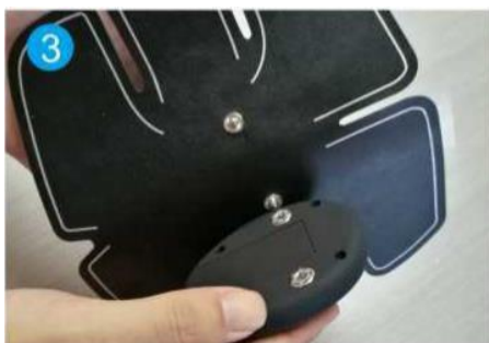
3. Připojte regulátor k jednotce