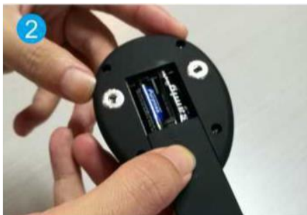
2. Vložte baterie (2xAAA)